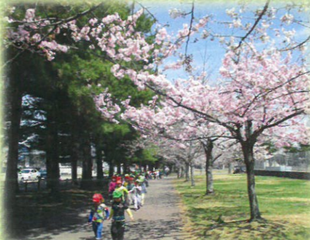
春をさがしに さくら並木の下をお散歩

当園の隣には大きな総合公園があります。公園で運動している方やお仕事している方と挨拶や会話を 交わし、園庭のようにのびのびと遊びを楽しんでいる子どもたちです。また、焼き芋の葉っぱを分けて頂き 焼き芋パーティーをしたり、周りの方にも支えられ、見守られながら大きく成長しています。