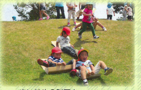
広い芝生の斜面を 段ボールでソリすべり