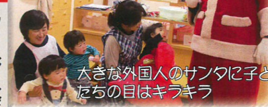
大きな外国人のサンタに子ども たちの目はキラキラ