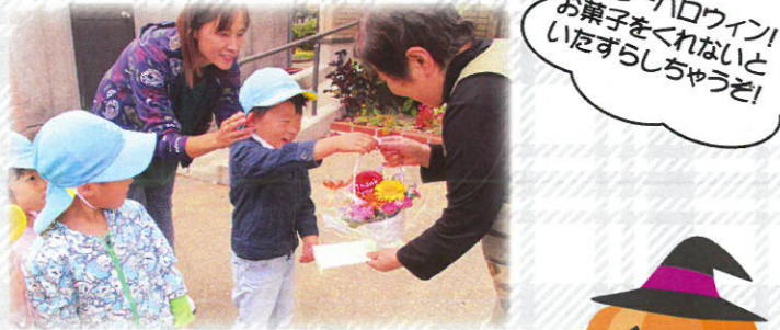
ハロウィンでお菓子を頂いた方々へ お礼のお手紙とお花を届けました。