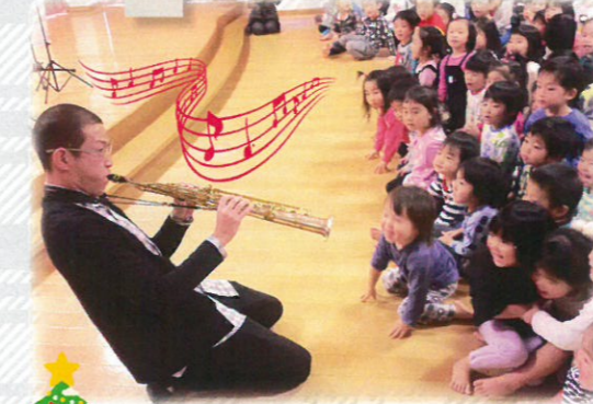
輝さんの素敵なサクソフ演奏会。 大好きな曲がたくさん流れました。