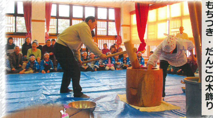
もちつき・だんごの木飾り