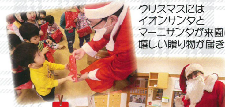
クリスマスには イオンサンタと マーニサンタが来園し、 嬉しい贈り物が届きました。