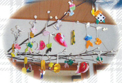
年長組の祖父母と一緒に お正月の伝統行事を 経験しました。